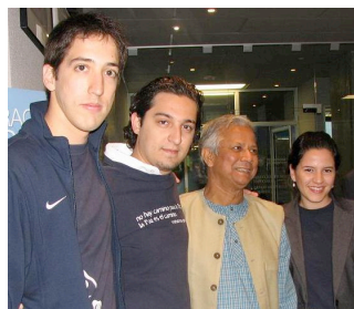
Con Mohamed Yunus, Premio Nobel de la Paz 2006