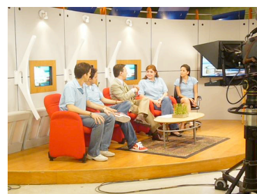
Durante una entrevista en los medios.