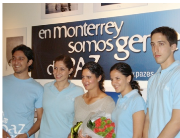
Con Lorena Ochoa.