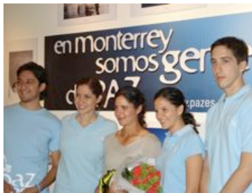
Con Lorena Ochoa.

Desde eventos deportivos hasta fiestas universitarias, Paz es... busca promover la conciencia ciudadana en todos los escenarios posibles, para demostrar que no es tan necesario alejarse de la rutina para participar en acciones positivas.