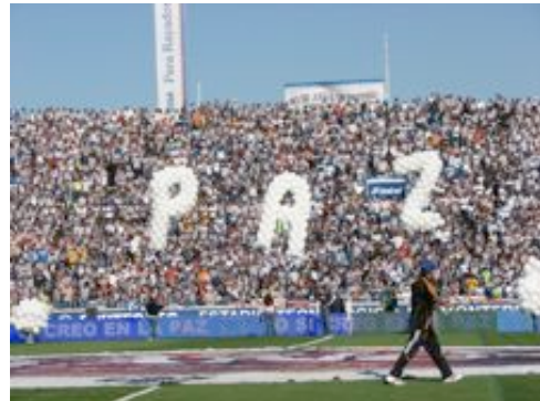
Promoción durante un partido de fútbol.

En Paz es... creemos que la participación activa de las personas en la comunidad es un gran apoyo para el desarrollo social de la misma: toda la gente tiene algo que dar. Es por esta razón que Paz es... enfoca sus actividades e iniciativas en diferentes áreas de impacto, dentro de las cuales pueden participar todas las personas.