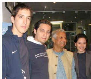
Con Mohamed Yunus, Premio Nobel de la Paz 2006