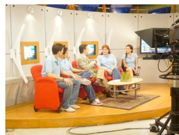
Durante una entrevista en los medios.